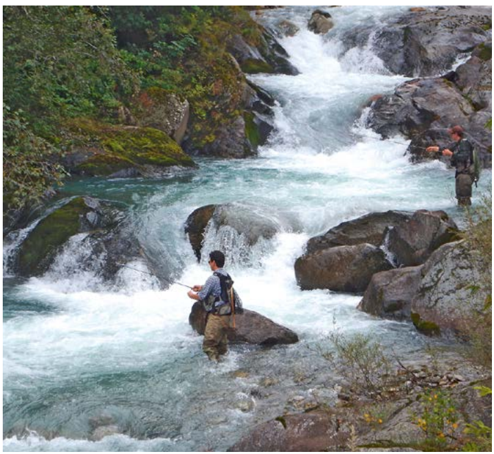
Wildbach Vermigliana - zone NK3