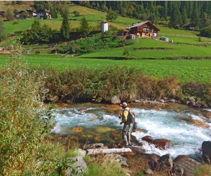
Wildbach Rabbies - "Le Marinolde" Reserve

Umgeben von den herrlichen Bergketten Adamello Presanella, Ortler Cevedale, Brenta-Dolomiten und Maddalene, ist das Val di Sole ein Gebiet von seltener Schönheit und erlaubt dem Fischer nicht nur das einzigartige Panorama zu bewundern, sondern gleichzeitig auch eine Vielzahl an sehr üppigen Gewässern zu finden, mit mehr als 120 km an Flüssen und 20 alpine Seen, wo Marmorierte Forellen, Bachforellen und Saiblinge zu finden sind.