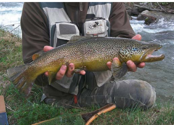
Marmorierte Forelle ... die Königin der Gewässer des Val di Sole